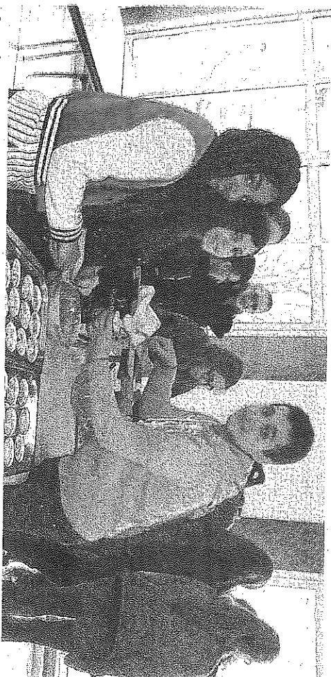
Les enfants ont fabriqué des muffins, cookies et brownies.

Nous sommes cousins et nous voyons très souvent. Quand on est ensemble on aime jouer au jeu de construction, ces petites pièces en bois qu'il faut entasser pour construire quelque chose. Elles tiennent sans colle donc il faut être précis lors de la construction. C'est une question d'équilibre mais aussi de patience. On peut faire mille formes, innombrables ou monumentales, en y ajoutant d'autres pièces, comme dominos ou legos. Nous avons construit le Big-Ben et la Tower Bridge. Cela alimente notre goût du bricolage et de la création.